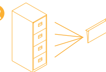
CC Single Filer